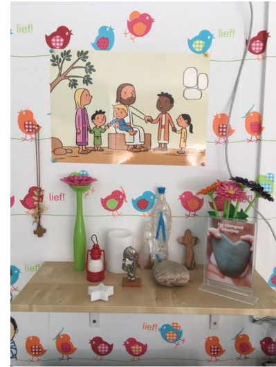
Onze godsdiensthoek vinden we terug in onze kring.