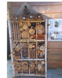
Ook onze tuin en moestuin geven ons veel leer- en ontdekkingskansen. We kunnen er kennis maken met de natuur.