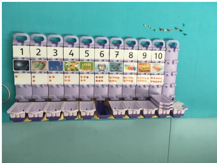
De rekenmuur gebruiken we bij activiteiten rond tellen.