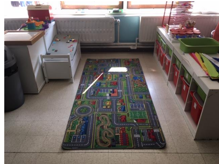
In de bouwhoek kunnen de kleuters spelen met de lego, de clics, de knex, de auto's, ...