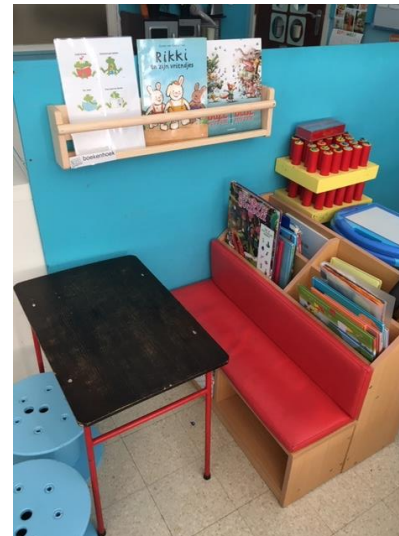
In de boekenhoek lezen de kleuters allerlei soorten boeken, prentenboeken, zoekboeken, fotoboeken,...