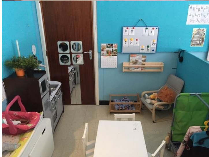
In de huishoek kunnen ze koken, de poppen verzorgen, zich verkleden,...